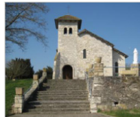
L'Église du centre-bourg, restaurée