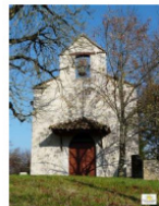
L'Église Sainte-Eulalie (XV e siècle)