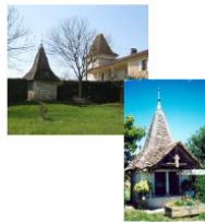
S te Eulalie : le puits