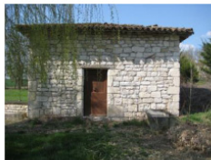
Lavoir de S te Eulalie