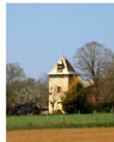
Pigeonnier à Pontié-Haut