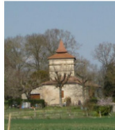
Pigeonnier, au Cardou