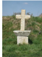
Le calvaire de Sol-Cardou