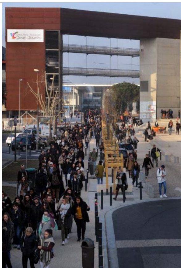
La sortie des étudiants sur la nouvelle rue de l'Université.