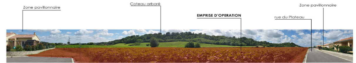
POINT DE VUE 1 : Point de vue rapproché

Un sol perméable et une nappe peu profonde.