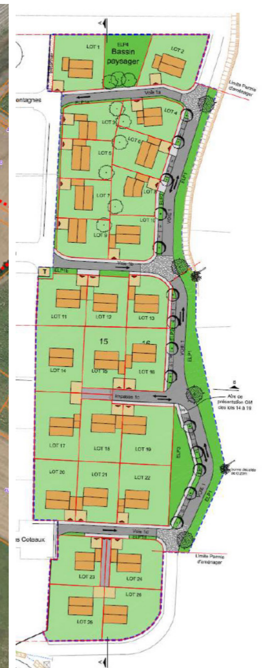
Figure 9 : Plan de composition du projet