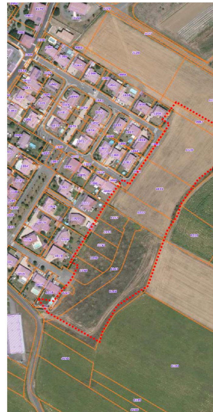
Figure 2 : Carte de localisation du projet